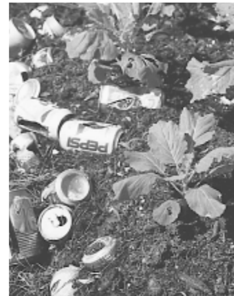
Les légumes poussent bien dans un mélange de terre et de boîtes de boissons.

Au lieu de boîtes vous pouvez utiliser aussi des écorces de noix de coco, qui sont poreuses et légères.