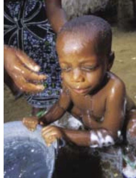
Jim Loring / Tearfund

A limpeza é importante para manter a boa saúde.