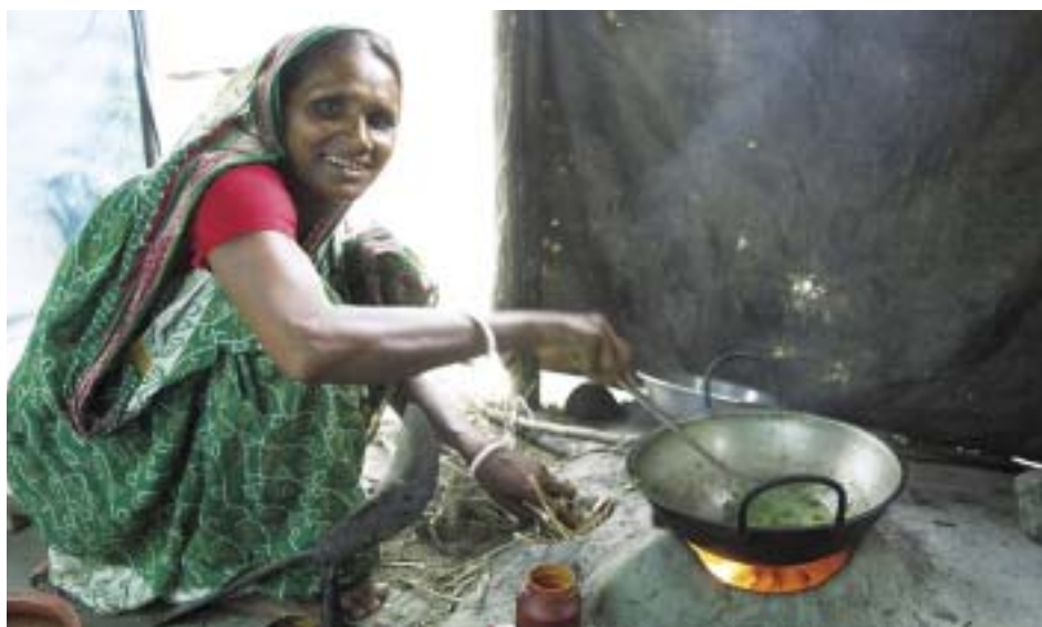
Geoff Crawford / Tearfund

Os bons hábitos de higiene e saneamento em casa ajudam a prevenir as infecções. Para