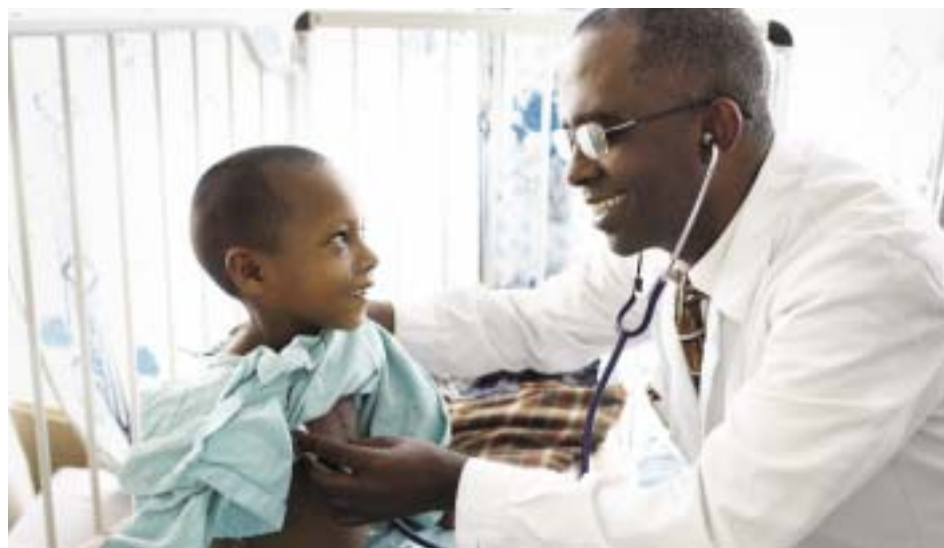
Muitas comunidades por todo o mundo têm pouco acesso aos cuidados de saúde hospitalares.

MALÁRIA Nem sempre é fácil reconhecer a malária, pois os sinais variam de local para local. O tratamento também varia. Os agentes sanitários cuidadosamente treinados