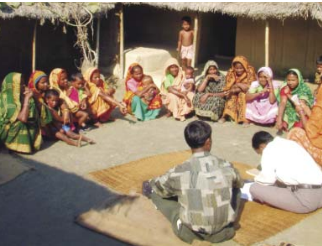
A LAMB ajuda grupos comunitários de base a defenderem e promoverem a provisão de saúde.

A LAMB Integrated Rural Health and Development é uma ONG cristã que oferece serviços médicos às comunidades pobres na região rural do noroeste de Bangladesh há 30 anos. A LAMB oferece cuidados de saúde em casa assim como através de clínicas locais e de um hospital com 150 leitos. Sua prioridade é apoiar a saúde das mulheres e das crianças.