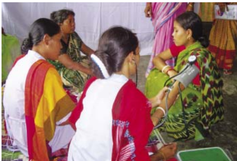
A LAMB concentra-se no treinamento de mulheres como promotoras da saúde e paramédicas.

A corrente é como uma comunidade local. Os elos representam as relações entre as pessoas de vários status. Se as tiras forem todas largas, a corrente será mais forte. Assim, se as pessoas de baixo status forem empoderadas, a comunidade inteira ficará mais forte.