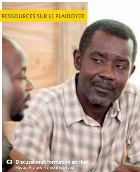
Discussion et formation en Haïti