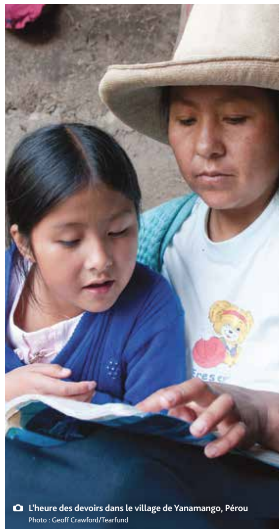
L'heure des devoirs dans le village de Yanamango, Pérou

PDF disponibles en français, anglais, espagnol et portugais. Exemplaires imprimés uniquement disponibles en français et espagnol.