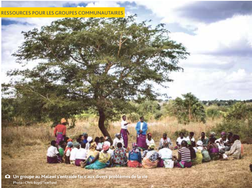
Un groupe au Malawi s'entraide face aux divers problèmes de la vie

Le processus Piliers encourage les groupes de toutes sortes à s'approprier leur développement par le biais d'un apprentissage basé sur la discussion.