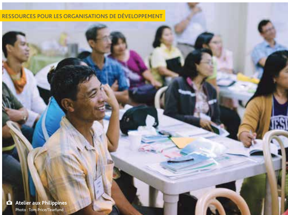
Atelier aux Philippines

Les guides Roots sont conçus pour aider les organisations chrétiennes de développement dans leur travail. On y trouve des informations détaillées sur des sujets liés au développement organisationnel ou sur les bonnes pratiques relatives aux principaux enjeux du développement.