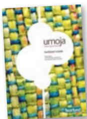
Cally Spittle Tearfund