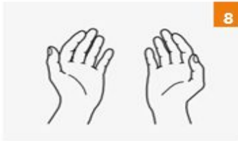
يديك نظيفة بمجرد أن تجف