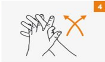
الكف بالكف وتشابك الأصابع