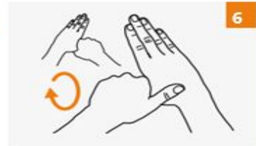
الفرك الدائري للإبهام الأيسر مع تثبيت الكف والعكس