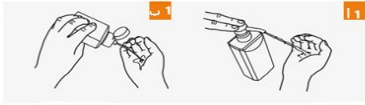
ضع من المنتج بيدك المضمومة؛ لتغطيها بشكل كامل