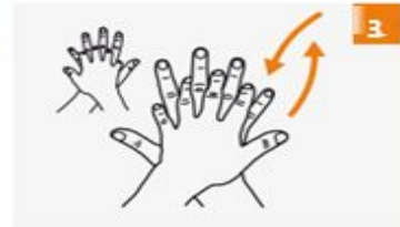
الكف الأيمن فوق الكف الأيسر بأصابعك المتشابكة والعكس