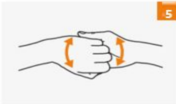
سحب الأصابع الى الخلف مع قفل الأصابع