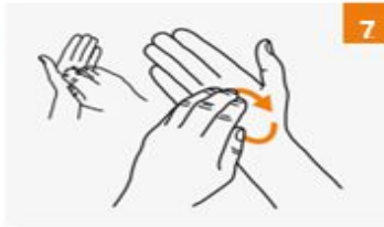
الفرك الدائري للخلف والأمام بأصابع اليد اليمنى المقلوبة على الكف الأيسر والعكس