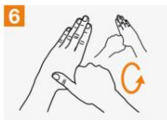
6 Rotational rubbing of left thumb clasped in right palm and vice versa;