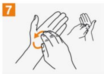
7 Rotational rubbing, backwards and forwards with clasped fingers of right hand in left palm and vice versa;