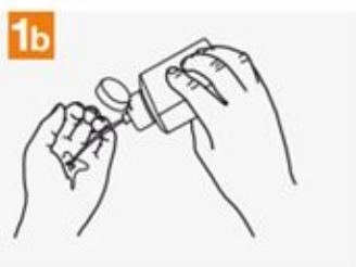
1b Rub hands palm to palm;