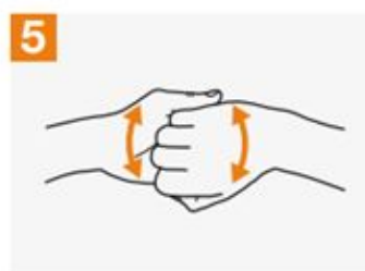
5 Backs of fingers to opposing palms with fingers interlocked;