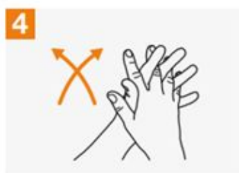
4 Palm to palm with fingers interlaced;