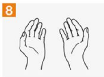
8 Once dry, your hands are safe.