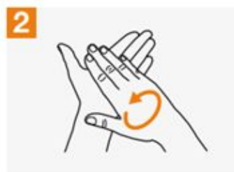
2 Rub hands palm to palm;