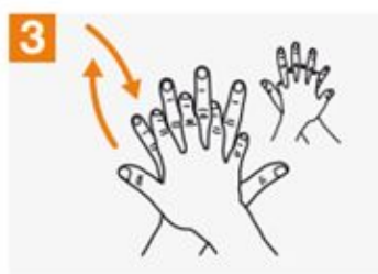
3 Right palm over left dorsum with interlaced fingers and vice versa;