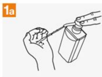
1a Apply a palmful of the product in a cupped hand, covering all surfaces;

⌚ Duration of the entire procedure: 20-30 seconds