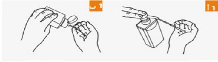
ضع من المنتج بيدك المضمومة؛ لتغطيها بشكل كامل