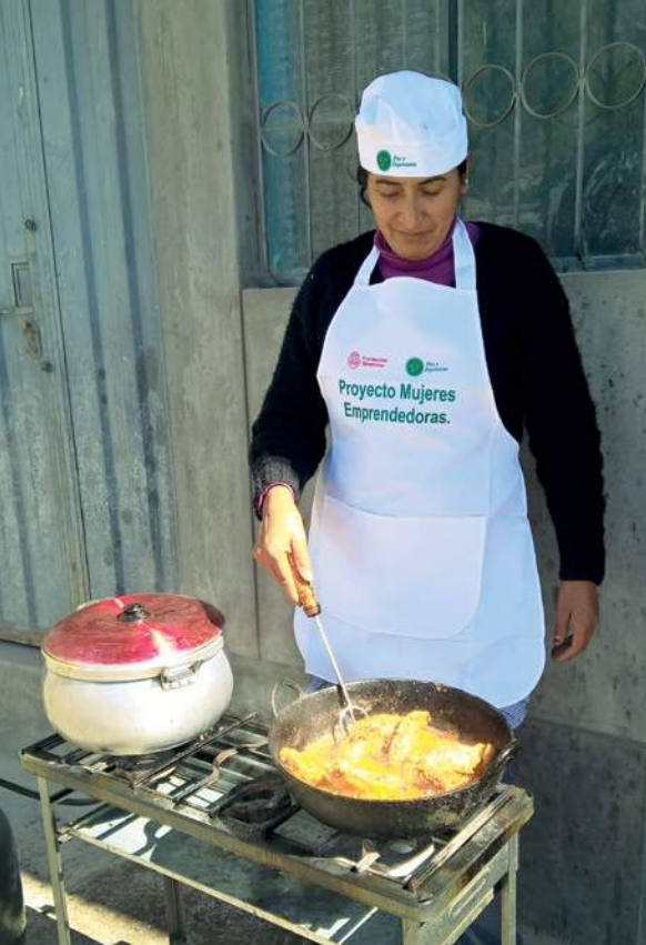
📷 Paz y Esperanza ayuda a mujeres emprendedoras a desarrollar y vender sus productos.

para ayudarlas a expresar sus necesidades. Las mujeres estuvieron de acuerdo en que sus principales prioridades eran la seguridad personal, oportunidades laborales para las mujeres y acabar con la violencia contra las mujeres.