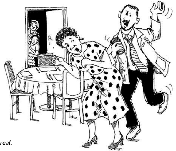
Los juegos de roles nos pueden ayudar a reflexionar sobre la violencia sexual y de género en un entorno seguro.

Los juegos de roles nos permiten representar situaciones que podrían ocurrir en la vida real. Nos ayudan a hablar sobre temas que consideramos asuntos privados o personales. Las siguientes actividades nos ayudan a pensar sobre por qué ocurre la violencia y acerca de los diferentes tipos de daños que causa la violencia sexual y de género (VSG). Las actividades pueden resultar eficaces si se realizan en grupos de hombres y mujeres.