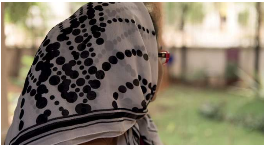
Las sobrevivientes de violencia sexual y de género suelen mantener silencio acerca de su dolor.

Las mujeres sobrevivientes de violencia sexual y de género (VSG) suelen mantener silencio sobre su sufrimiento, lo cual alimenta su sensación de aislamiento. Entre las razones por las que no hablan abiertamente pueden incluirse amenazas por parte de sus agresores, el miedo al estigma y la discriminación, y una falta de esperanza de que alguien pueda ayudarlas.