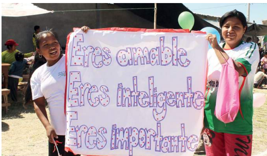
Estas niñas participan en una campaña de creación de conciencia para luchar contra la violencia sexual y de género.

Hace varios años, Paz y Esperanza comenzó a trabajar con las mujeres de una comunidad