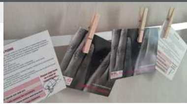
Tarjetas con la promesa de We Will Speak Out.

Entidad benéfica registrada n.º SC037624 (Escocia)