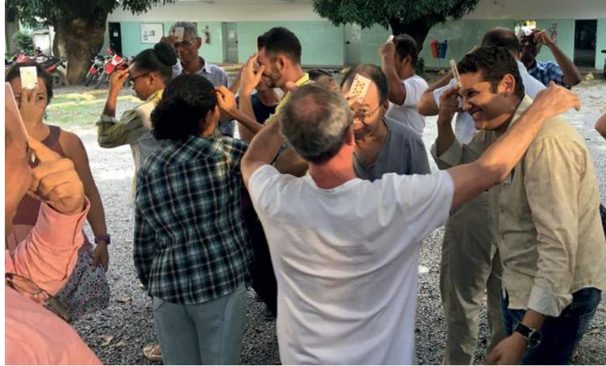
Un grupo participa en una actividad de Transformando Masculinidades en Brasil sobre género, poder y estatus.