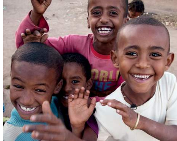
Es importante involucrar a los hombres y los niños en el trabajo de prevención de la violencia sexual y de género.

gente entienda que es importante involucrar a los hombres y los niños.