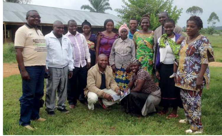
Un grupo de miembros de los grupos de acción comunitaria se reúnen para apoyar a las mujeres sobrevivientes de la violencia sexual y de género.

* El nombre se ha cambiado para proteger la identidad.