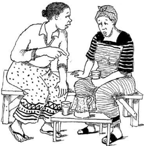
Las palabras inadecuadas pueden ser como una puñalada en el corazón para las sobrevivientes de la VSG.