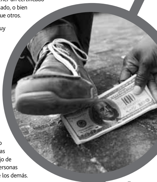
Jay Butcher / Tearfund