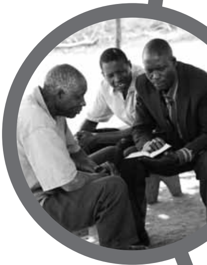
Jay Butcher / Tearfund

Todos estos recursos se encuentran disponibles en el sitio web de la Zona de Aprendizaje Internacional de Tearfund: http://tilz.tearfund.org/Research/Governance+and+Corruption