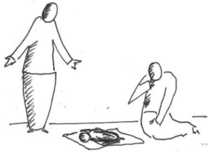
Perda de vidas, especialmente das pessoas mais vulneráveis (crianças, mulheres, idosos, pessoas com deficiências).