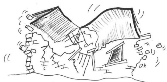
Danos a edifícios e infra-estruturas.

No entanto, é possível proteger as vidas, os bens e os meios de subsistência das pessoas quando são tomadas medidas para reduzir ou acabar com a sua vulnerabilidade a desastres.