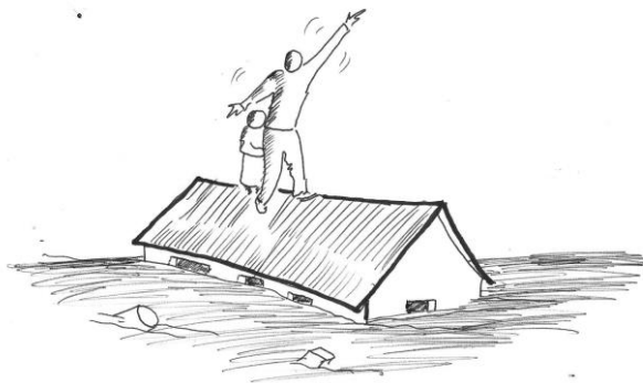
Habitacões danificadas e