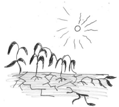
Falha das colheitas e perda de meios de subsistência.