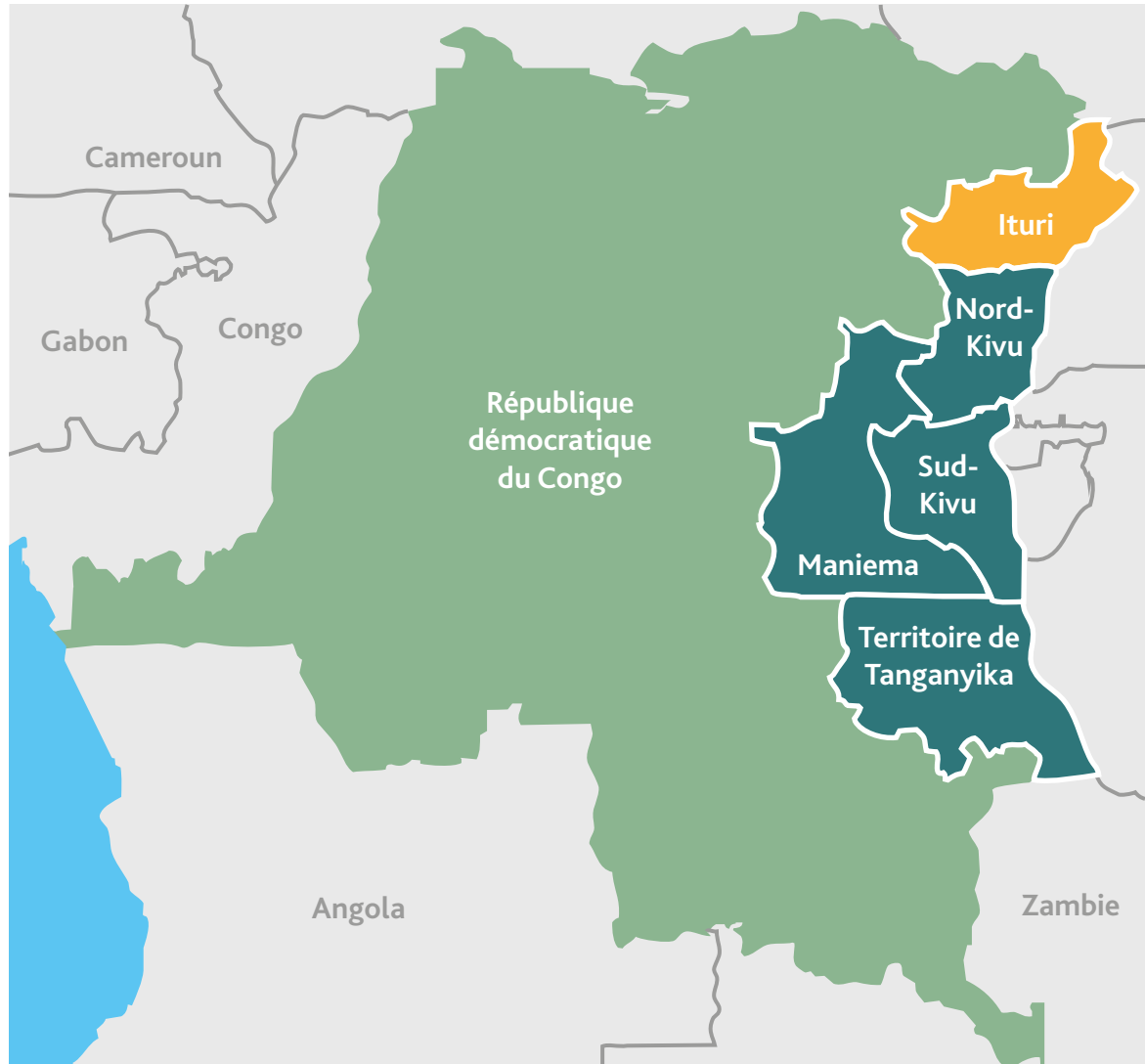
Figure 1 Carte de la République démocratique du Congo

Le présent rapport étudie les résultats clés de l'enquête de base sur les ménages, réalisée dans l'ensemble des communautés cibles en juillet 2015.